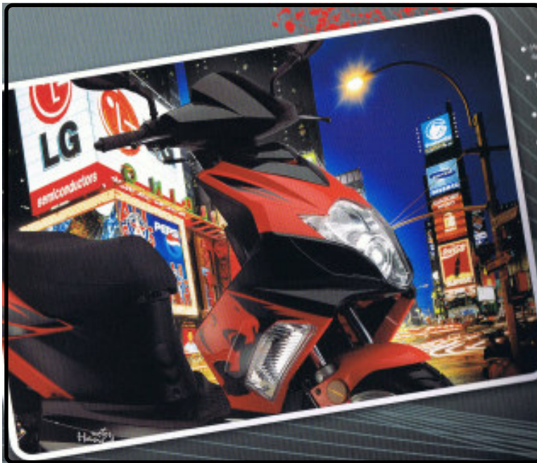
- den modernt designade och eleganta fashion scootern