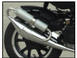
- levereras med sportljuddämpare