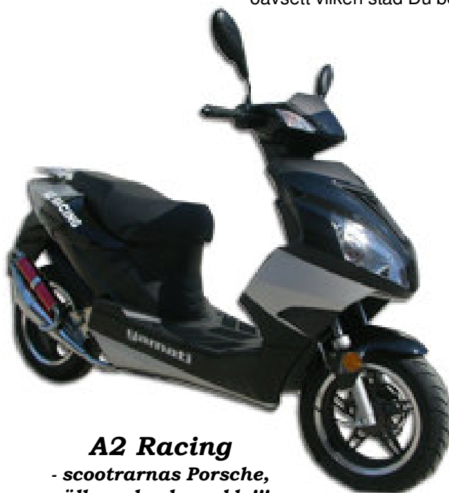
A2 Racing - scootrarnas Porsche, välbyggd och snabb !!!

A2 Racing EU45 2-takt - levereras med 2-takts sportsystem.